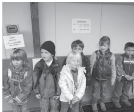
Unsere kleinen Forscher in der Apfelwaage wiegen 125 kg. Das wären 75 Liter Saft.

Gemeinsam machten wir uns morgens auf den Weg nach Neuhausen zur Mosterei "Reusch". Dort erfuhren wir, wie aus Äpfeln-Süßmost hergestellt wird. Von der Waage übers Förderband durch die Apfelwaschanlage bis zum Trester konnten wir alles genau verfolgen. Krönender Abschluss waren die vielen verschiedenen Säfte, die wir probieren durften.