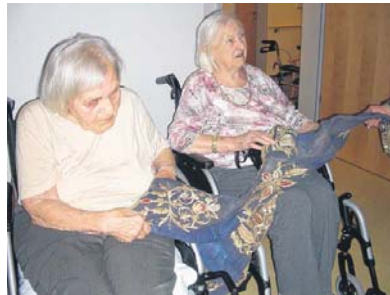
Interesse an türkischen Stickereien

Melden können Sie sich bei uns telefonisch 07121/892-167; per E-Mail fee@eningen.de, über die Homepage www.eningen-fee.de oder persönlich dienstags zwischen 15.00 und 17.00 Uhr, Rathaus 2, 1. Stock, Zimmer 14, 72800 Eningen unter Achalm.