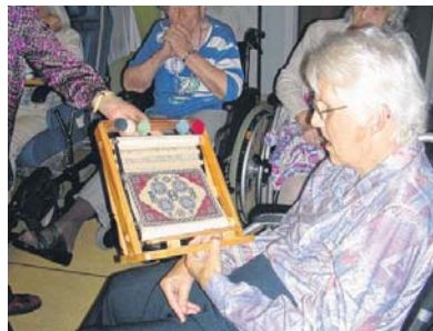
Ein türkischer Musterwebstuhl mit Teppich