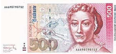
Maria Sibylla Merian im Altencub